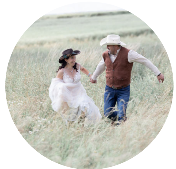
Clean White Alle Farben bleiben den Ursprungsfarben er- halten, der Grünerton ist etwas heller