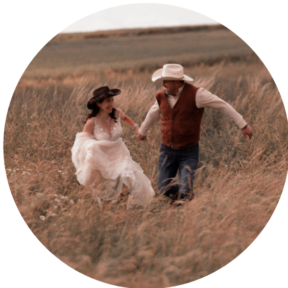
sunset red Das gesamte Bild bekommt einen rotbraunen Flair

Eine Bildübergabe in Originaler Bildfarbe ist nicht möglich.