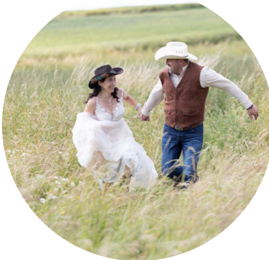
Original Es werden keine Bilder im Originalzustand übergeben